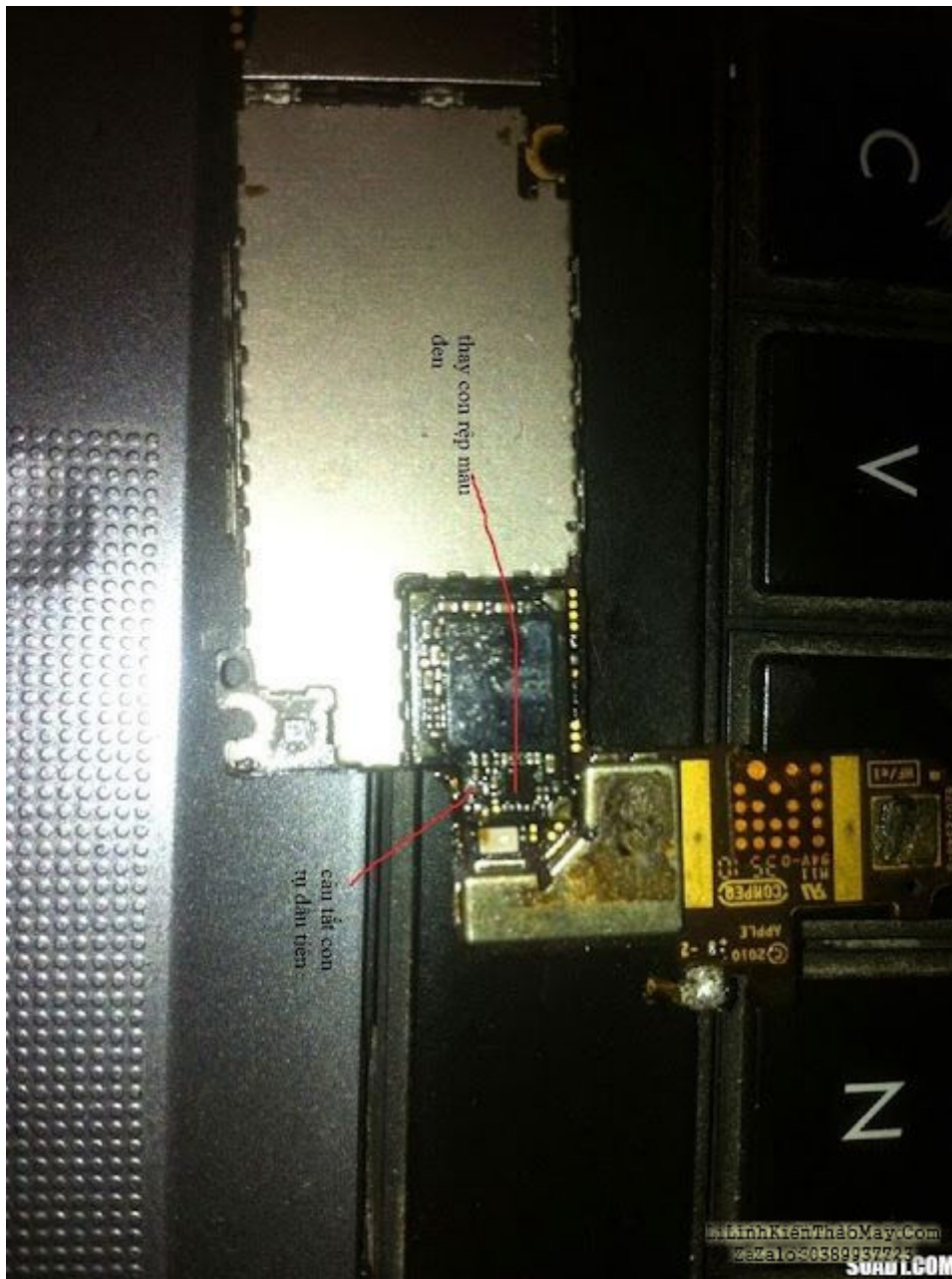
Một giải pháp khác sửa wifi trên iphone 4

Giải pháp cho iphone 4 rớt nước lỗi ic wifi