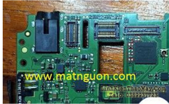
oppo R1001 liệt cảm ứng