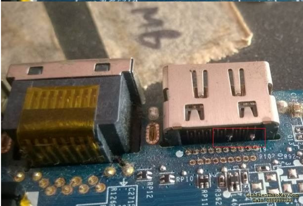
Cổng HDMI bị lòi chân làm chạm nguồn 5V

Kết luận : Với những bệnh chạm nguồn anh em cần nhìn kỹ trên main xem có bị dính nước làm oxy hóa gây chạm không. Bệnh chạm nguồn này không những gặp ở cổng HDMI mà còn gặp ở cổng USB 2.0, USB 3.0 nữa. 1 điều quan trọng nữa là đo điện trở ngay khi kích nguồn, vì đo nguội trước khi kích không phát hiện ra chạm chập. Vậy là xong, chúc anh em vui vẻ ! anh em có gặp pan nào lạ về laptop thì chia sẻ để mọi người học hỏi nhé.