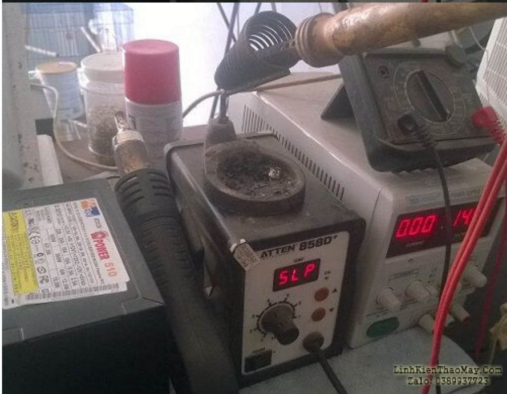
Dụng cụ cần thiết để sửa phần cứng

+ Nguồn test main : Nguồn test main thì nên xài các loại nguồn xịn như Acbel, Cooler Master...Vì xài nguồn thường thì mỗi lần mainboard bị chập kéo theo nguồn chập, cái này mình bị rất nhiều. Và nguồn nên có công tắc phía sau để tắt mở cho nhanh. Nếu không mua được nguồn xịn thì có thể lấy nguồn từ các máy bộ pentium3 , pentium 4 của máy HP, DELL...những loại này xài rất bền, nhưng cần cầu thêm jack cắm 12v cho điện áp cpu. Lấy jack này từ nguồn bình thường sau đó hàn vào chân màu vàng 12v và chân mass là được (vì nguồn máy bộ đời cũ không có jack 12v).