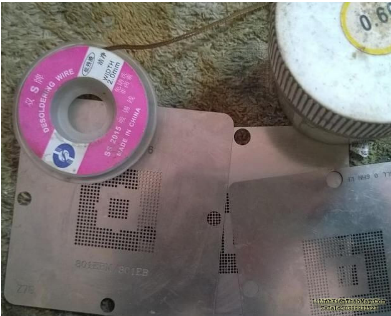
Dụng cụ làm chân chipset

Và cuối cùng là mua ve chai vi tính, giúp cho tay nghề lên rất nhanh, đồng thời cũng kiếm lời được từ nó nếu bạn sửa cho main chạy được. Khi tay nghề đã lên thì anh em có thể sắm thêm cái máy cấp nguồn đa năng để sửa laptop. Đó là 1 số dụng cụ để sửa mainboard, chúc anh em nhanh lên tay nghề.