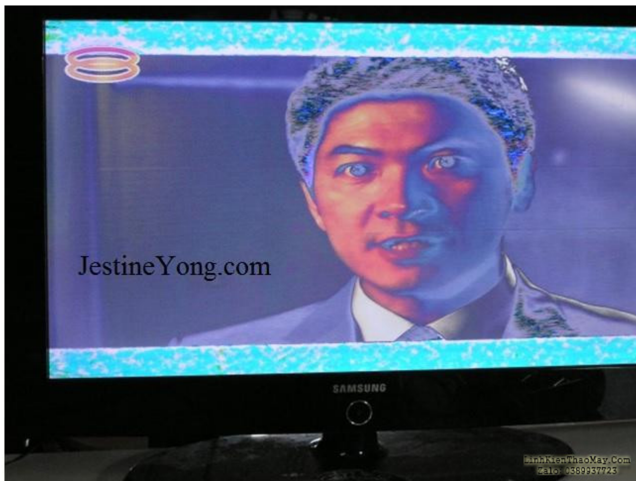
Ảnh 1: Ảnh hưởng của thang màu xám bất thường trên hình ảnh kênh truyền hình

Hầu hết các nhà sản xuất TV LCD không cung cấp sơ đồ cho bo mạch T-con và có rất ít thông tin trên internet. Phát hiện IC hiệu chỉnh gamma không phải là một vấn đề vì chỉ có một số IC trên bo mạch. IC hiệu chỉnh gamma hoặc Bộ đổi điện trên bảng T-CON này được dán nhãn là U6 với ký hiệu "AS15-G" và nó có giá chỉ khoảng 4 đô la Mỹ.